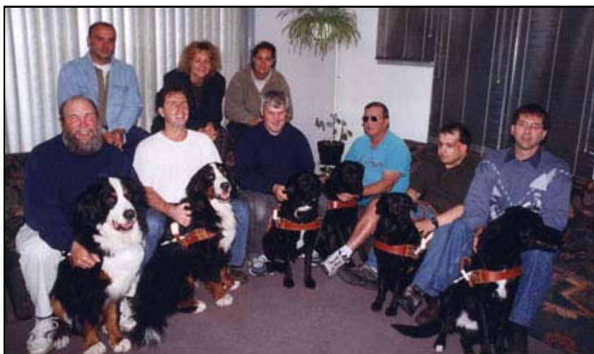
En septembre 2000, il a été reçu finissant de la Fondation Mira et a eu droit à son chien-guide

Dès le début de ses études universitaires, il s'intéressa à la criminologie. Il participa à un stage dans le cadre d'un séminaire en maîtrise à l'École de Criminologie. En 1996, il travaillait comme clinicien (évaluation criminologique) à l'Institut Louis-Philippe Pinel.