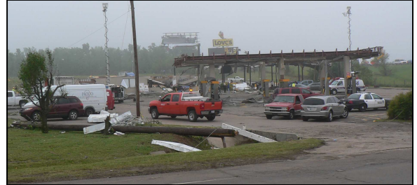
Photo de la station-service Love's, le matin du 11 mai

L'alerte est levée, le ciel redevient bleu avec des nuages blancs... on nous dit que tout près, en bas de la côte, les stations services sont complètement fauchées. Nous avons fait le plein d'essence à la station LOVE'S deux heures plus tôt. Quelques minutes plus tard, nous irons voir à pied les dégâts. Dans les conversations avec les résidents américains du coin, on nous dira plusieurs fois que les résidents du camping ont été chanceux, vraiment chanceux.