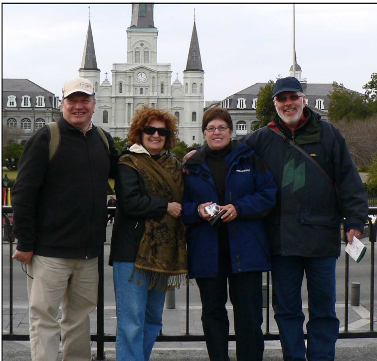
Les quatre voyageurs

Mais tout ceci ne ternit en rien le magnifique voyage que nous faisons. Il nous reste deux semaines et demie!