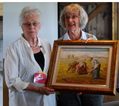
Plusieurs tirages ont eu lieu durant l'après-midi; 3 livres de Gaétan(107), une toile d'Odette(52), un « macramé » d'Ursule (111), un livre d'Ivanhoë III (80) . Merci à tous