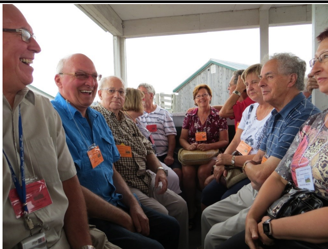
En route vers le champ aux bisons.

Sincères salutations à chacun de vous, chers membres