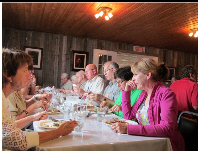
Au dîner à la Ferme La Bissonnière, nous étions 71 personnes.