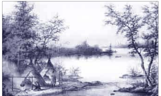
Campement indien près de la rivière des Outaouais, Ontario [ca 1870]

Lorsque l'ombre du soir arrive, Je me fais un lit de sapin. Couché près de la flamme vive, Je rêve et dors jusqu'au matin.