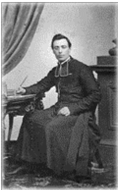
Auteur L'abbé Henri- Raymond Casgrain (1831 - 1904)