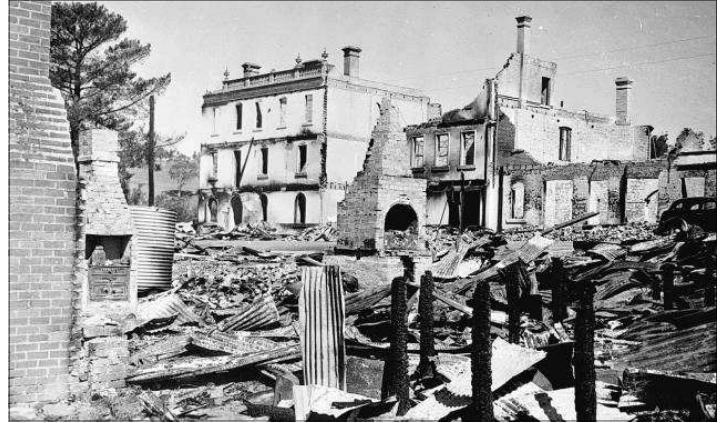
Ruines de l'Hôtel Golden Age après l'incendie de 1939.

Le 13 janvier 1939, un important feu de forêt a détruit le village d'Omeo et le magnifique hôtel d'Elizabeth y a passé; il n'en restait plus qu'une carcasse fumante.