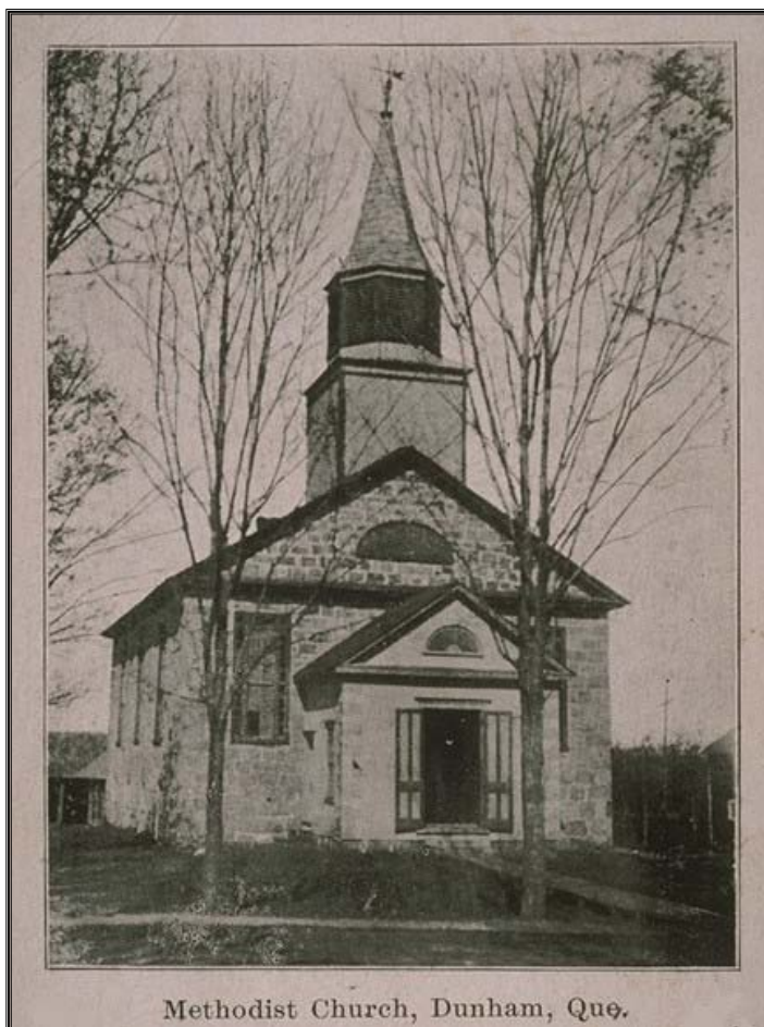
Methodist Church, Dunham, Qué.