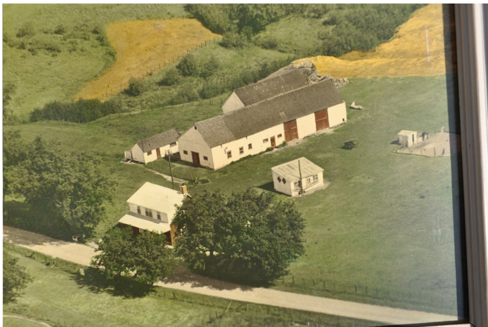
Une photo de la ferme avant le déménagement de la maison avant le 26 décembre 1953.

Une photo dans les années 1970, vous remarquerez l'ajout d'une chambre à lait et l'agrandissement de l'étable pour permettre de loger et traire plus de vaches à lait.