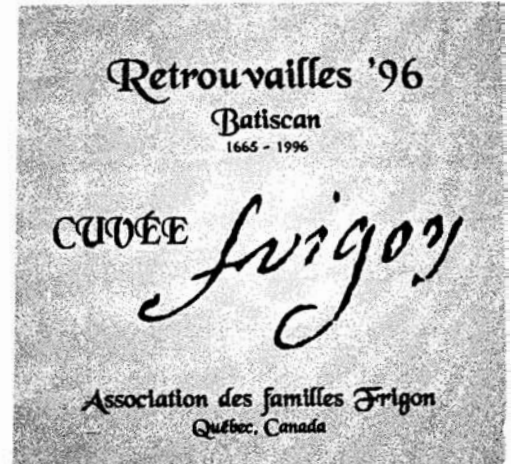
Association des Familles Frigon Site WEB: frigon.org