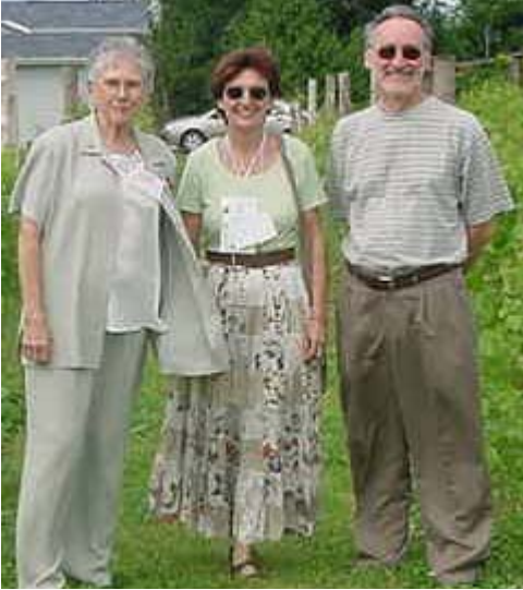
Le trio dynamique