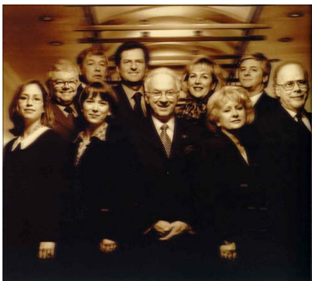
Tiré du Rapport Annuel - SAQ 2000 - La nouvelle SAQ - Cap sur le commerce*