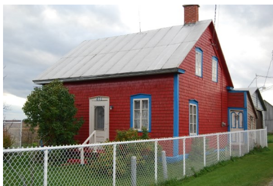
Au fond, à droite on voit la porte de la cuisine d'été

Il existe de nos jours très peu de ces petites maisons d'agriculteurs du 19 e siècle construites en bois et encore debout pour témoigner de cette époque révolue. Aussi, celle-ci mérite-t-elle qu'on en raconte l'histoire pour qu'elle reste dans la mémoire collective. Elle a fière allure avec ses murs extérieurs en bardeaux taillés à la main, sa toiture en tôle à baguette, sa cheminée à double conduits, sa cuisine d'été, ses doubles planchers en pin, son entrée de cave à l'extérieur de la maison et sa trappe à l'intérieur de la maison pour un accès à la cave durant l'hiver.