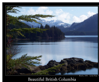
Beautiful British Columbia