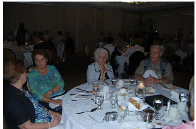
Quelques convives au souper à l'Auberge Godefroy