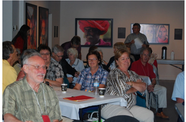
Une partie des membres présents à l'Assemblée annuelle au Musée des religions.

Une journée agréable et bien remplie, qui se termine par un souper copieux à l'auberge Godefroy. Tous et chacun furent ravis et, sous les embrassades, se dirent " à l'an prochain ".